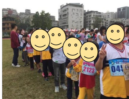
◆參加亞特盃(體育比賽)