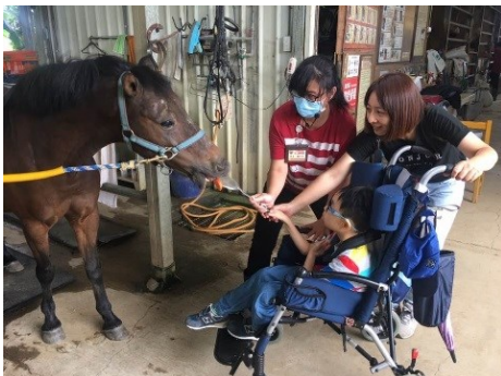
◆校外教學馬場體驗