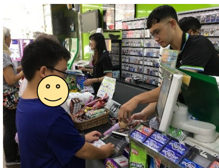
◆社區教學-商店購物