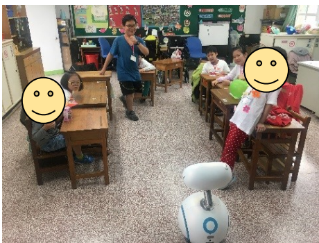
◆學生與機器人互動