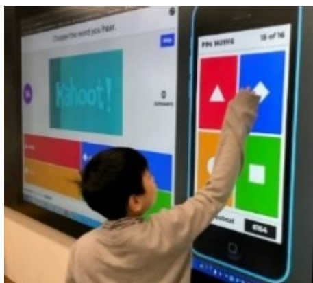
學生聆聽單字並利用 Kahoot 選擇題功能選出正確單字選項。