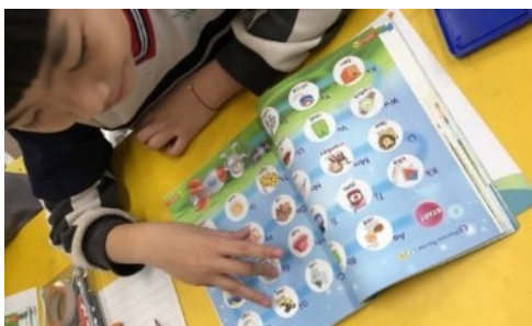
學生聆聽字母名、音和代表單字並用手指指認。