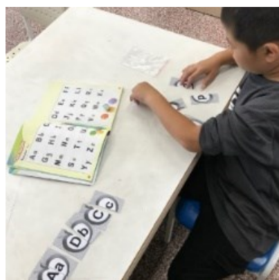
學生配對字母大小寫卡片。