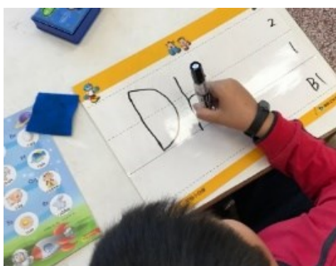
學生聆聽字母名並寫字母。