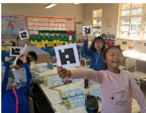
學生看單字圖片並利用 Plickers 選出正確單字。