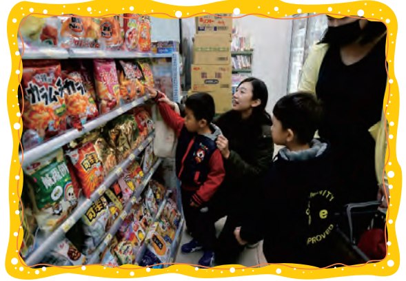
我們去便利商店買餅乾