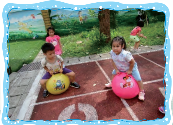
跳跳球可以訓練腿部的肌耐力