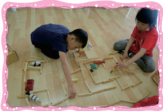
建構區-KAPLA建構有趣的動物園