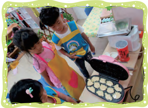
小小廚師烤了十二生肖造型 的雞蛋糕，太香了！