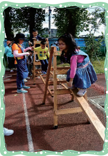
我的平衡感很好喔！