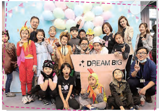
雙語師生參與雙語嘉年華戲劇表演