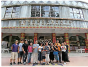
106年 達比拉斯： 汶水國小(泰雅族)