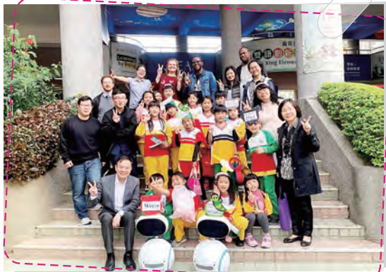
學生與外師參與 109年度雙語教學成果展