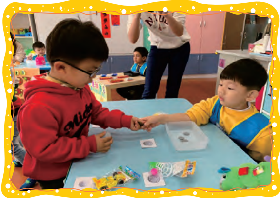
我們邀請小熊班小朋友來買東西