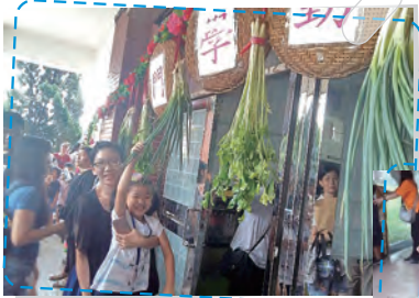
小一新鮮人 進入勤學門