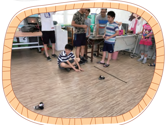
自走車比賽 看誰跑得遠