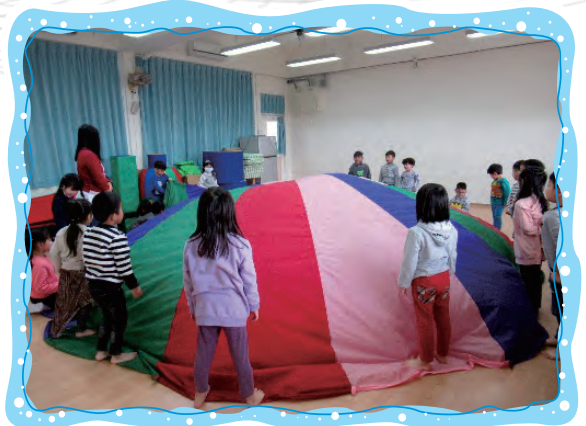
氣球傘可以做各種變化-這是我們做的大漢堡，準備吃漢堡囉！