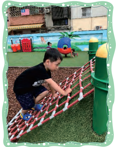
手腳並用爬上小山丘