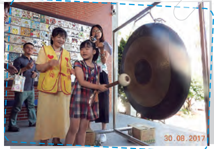
敲響智慧鐘，一鳴驚人