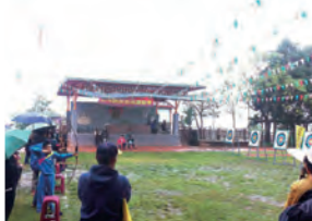
104年 莎卡蘭： 口社國小(排灣族)