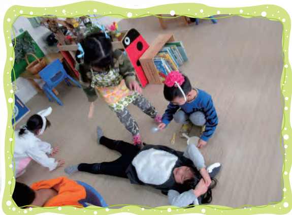
戲劇扮演-大野狼吃了小兔子， 媽媽用剪刀剪開肚子救出小兔子