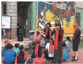
108年 巴蘭： 仁愛國小(賽德克族)