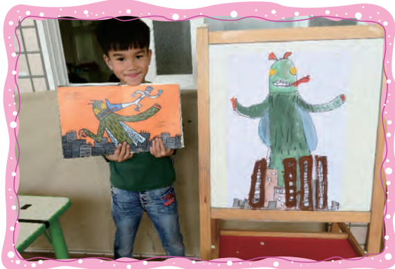
水彩區進行正義使者的繪本仿畫