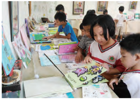
親子繪本展 跨越每個成長階段的閱讀挑戰