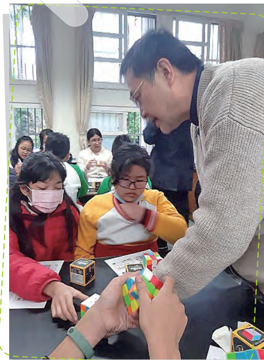
校長魔術方塊指導 手腦並用促進思考