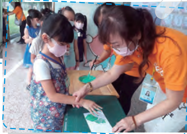
來來來 新生小手拓印囉!