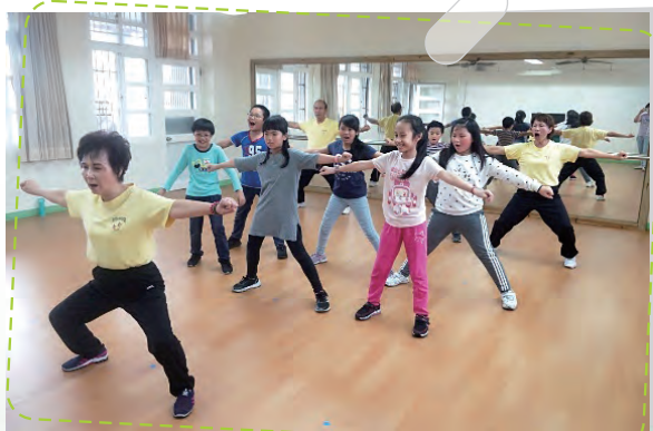
彈腿志互教授一至六年級課照學生彈腿 增進體能活力