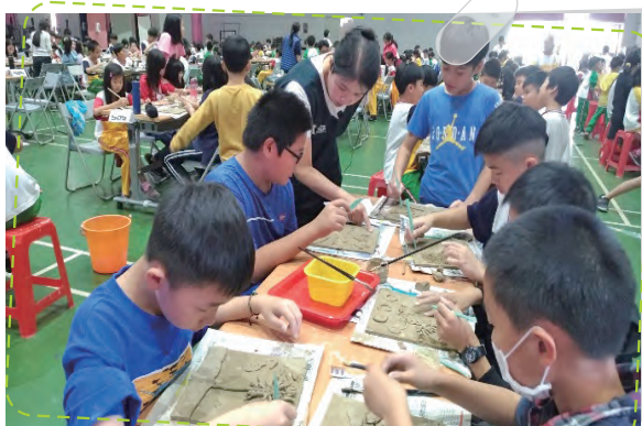
一二三五年級師生陶板創作 妝點校園牆面