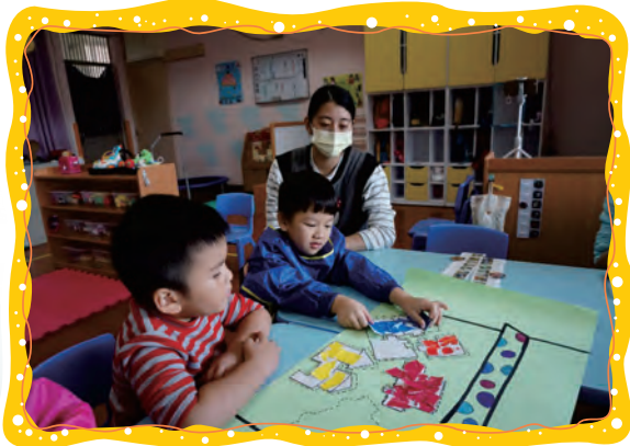
我們製作商店的招牌