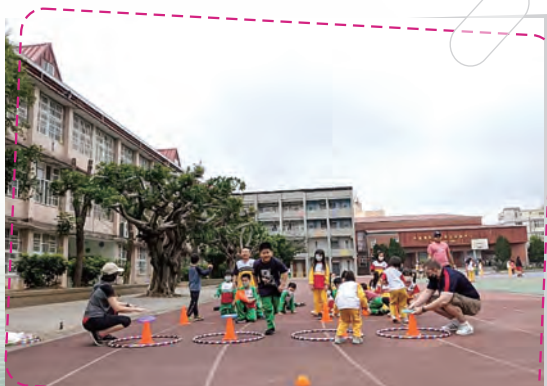
雙語體育課程中外師協同教學 學生樂在學習