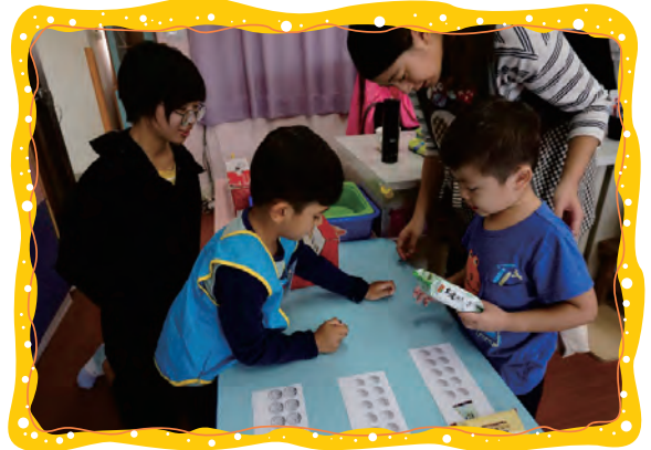
我們練習看錢幣買東西