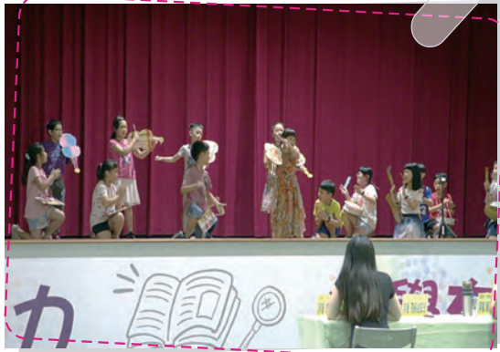
每年三年級雙語話劇成果發表