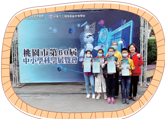
科學展覽競賽市賽榮獲佳績