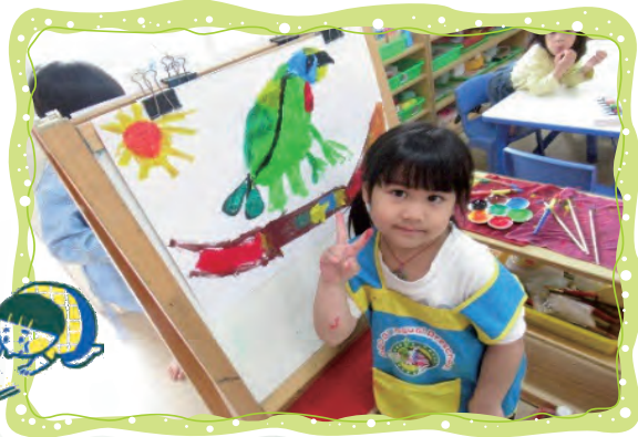
用水彩畫出臺灣山林裡的鳥-五色鳥