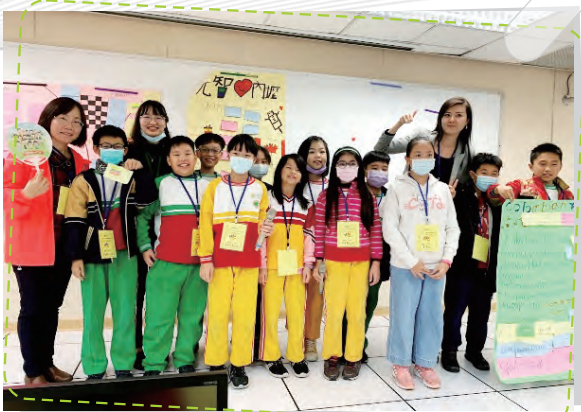
元智內握大手牽小手雙語校際交流 提升雙語成效