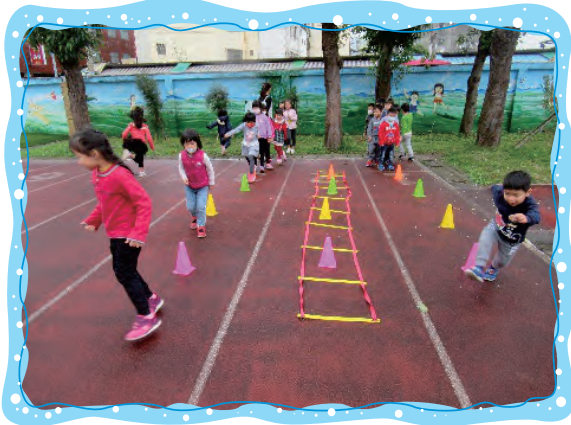
繩梯跳躍及三角錐S型拐彎跑