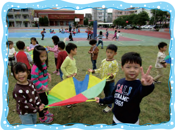
大家合作讓小氣球傘上的小球不掉出來