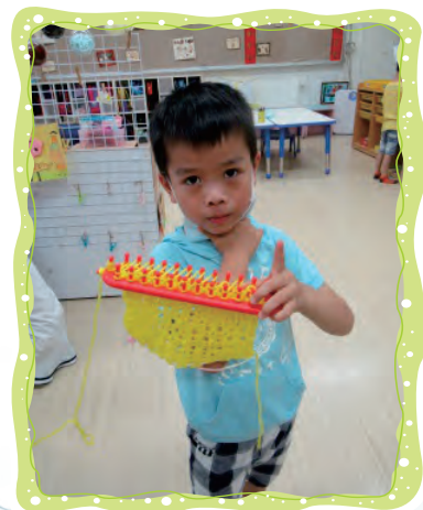
用毛線做編織， 我要做是一個包包