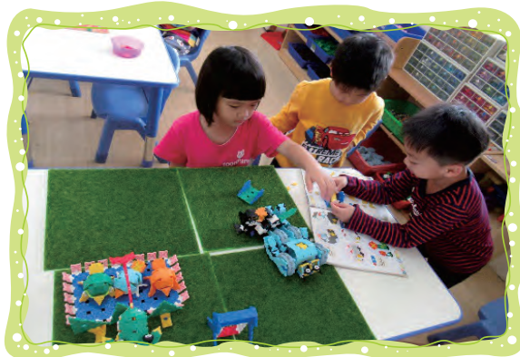
研究說明書，照著步驟做出了機器人