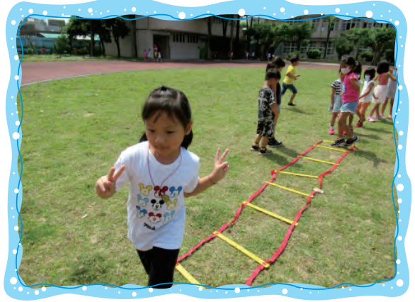
在繩梯上做各種動物-兔子、螃蟹、猴子等