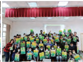
提袋畫成果展示~與畫家合影展現創作