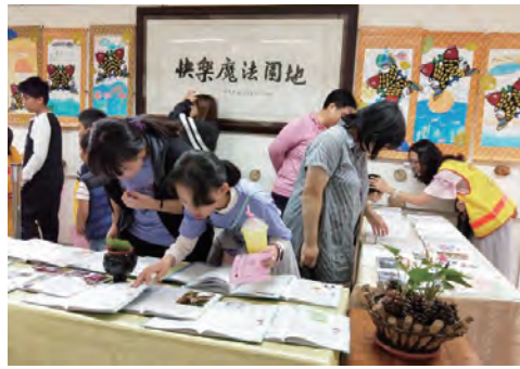
美學手札展 呈現美的張力與美感