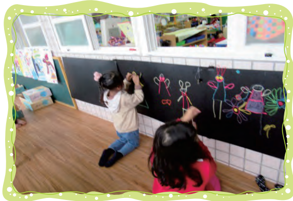
在黑色底板用七彩蠟繩創作