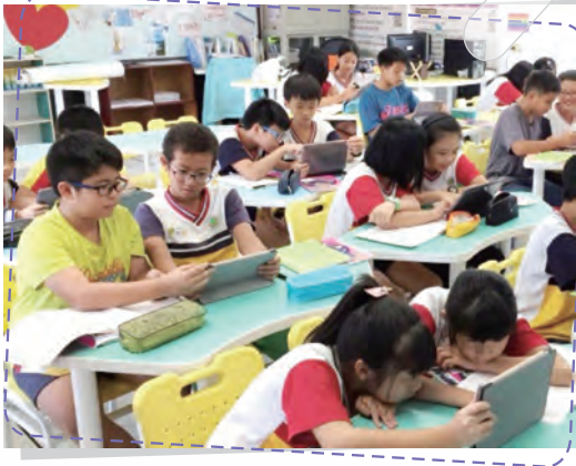
智慧閱讀 回饋零時差