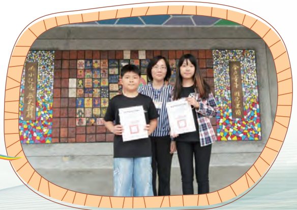
電腦競賽市賽SCRACH得獎頒獎