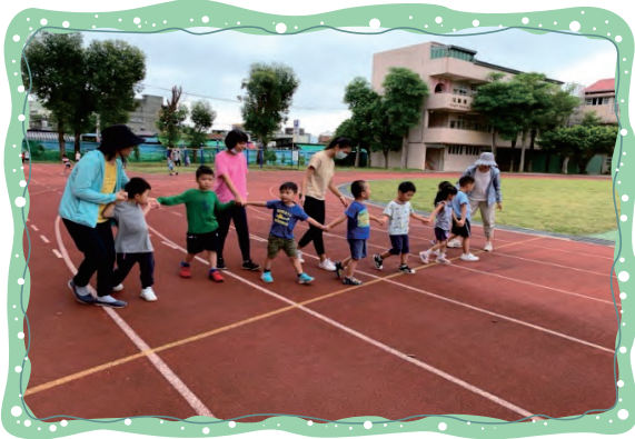
手牽手，在校園內散步