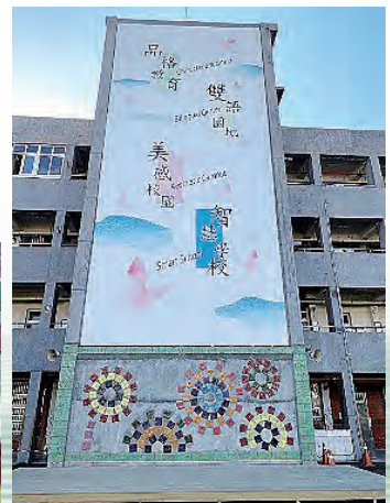
陶板畫裝置於學校牆面 增添校園美感