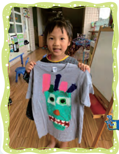
把設計好的圖騰用 壓克力顏料畫在衣服上