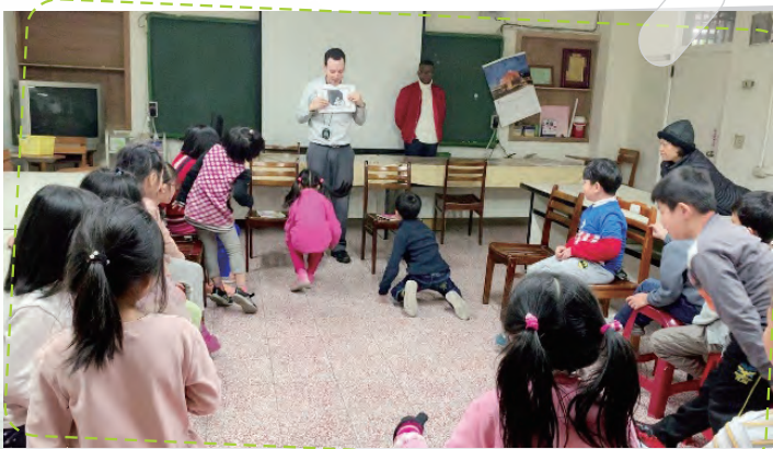
外師課後照顧英語說故事 沉浸式提昇語言力