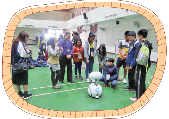
智慧教學 學生與智能ZENBO互動