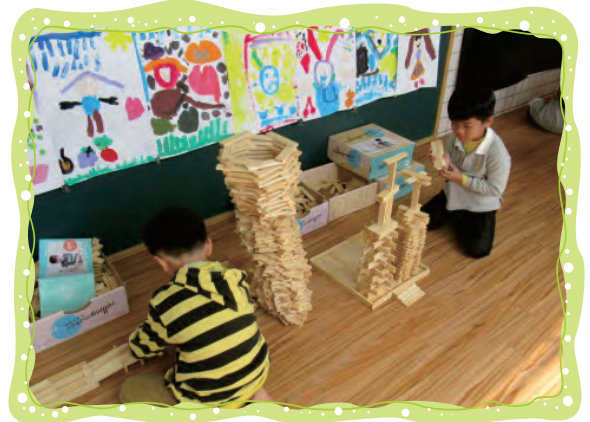
小小建築師-用Kapla積木 創作高樓大廈