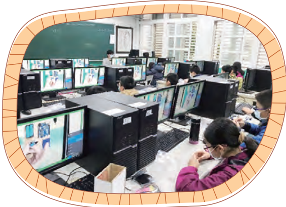
智慧創客組裝自走車