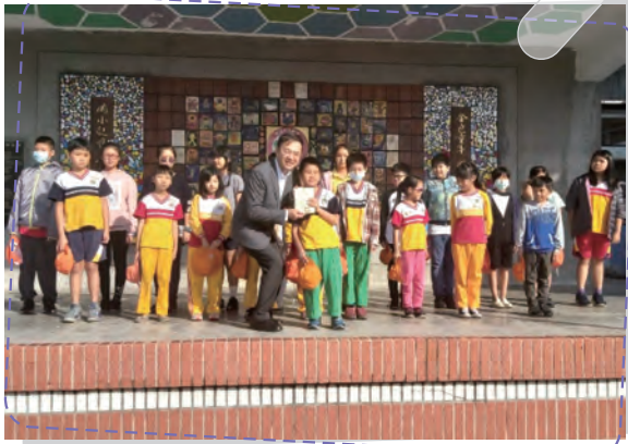
各式閱讀認證頒獎