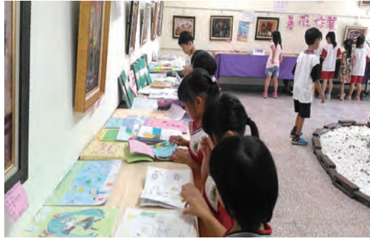
美勞優秀作品展出 觀摩學習提升自我