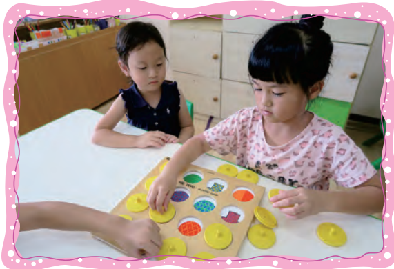
數學區好玩的桌遊-顏色形狀對對碰