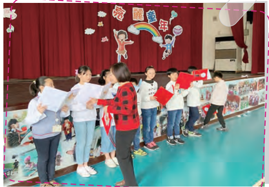
學生參與每年桃園市讀者劇場競賽