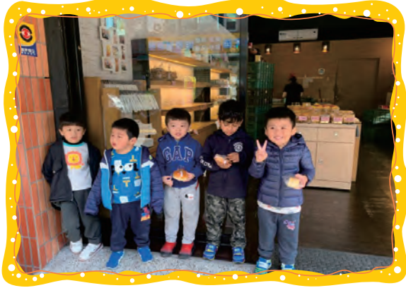
我們社區適應去麵包店