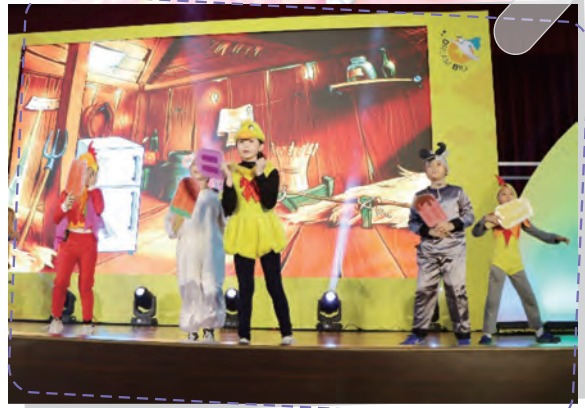
全市雙語嘉年華發光舞臺 熱情演出創意劇本