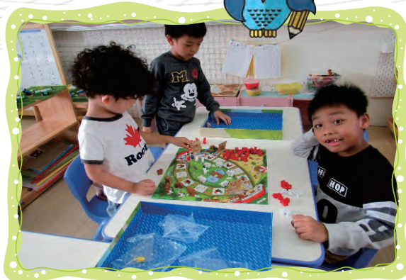
快樂農場桌遊，數一數 我換了幾隻雞？幾隻綿羊？