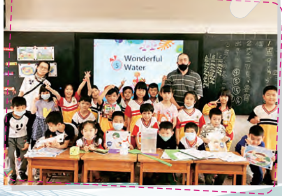
雙語生活課程中外師協同教學 學生ENJOY學習