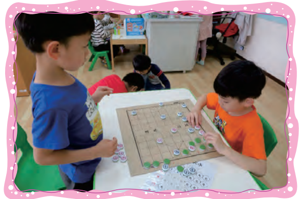
數學區跟同學一起挑戰象棋