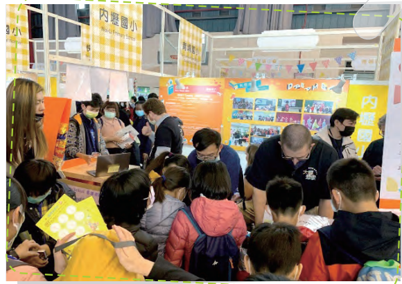
雙語關關 檢核英語學習實力