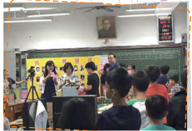
猜猜我是誰摸彩， 看誰是幸運兒?