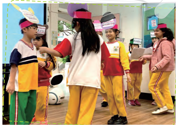
表演教學 展現肢體動作美力