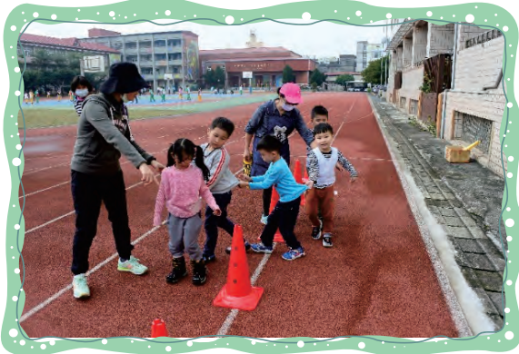
小火車繞過來繞過去