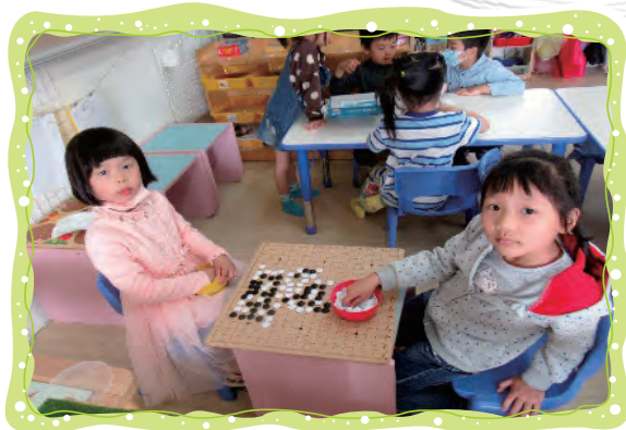
圍棋、五子棋的對弈