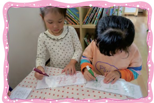
語文區進行聽說讀寫的活動