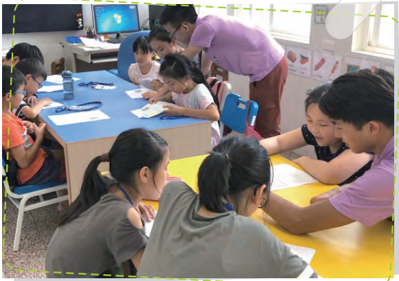
海外青年引導學生多元學習