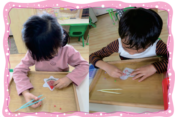
美勞區進行好玩的拼豆創作