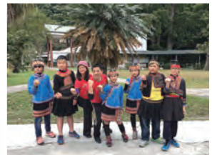
105年 丹那： 廣原國小(布農族)