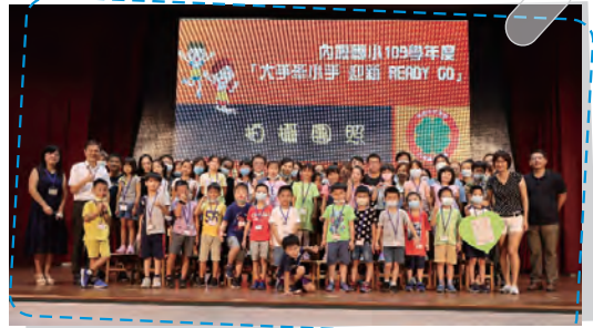
新生始業式親師生團照，十分溫馨