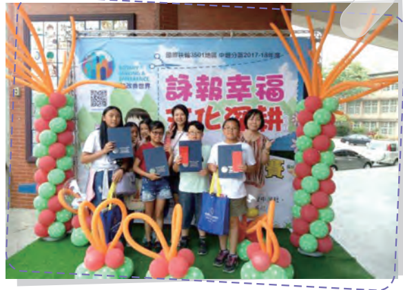
剪報比賽成績斐然 榮獲優等