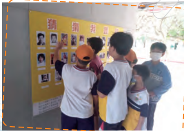
教師節猜猜我是誰? 這是哪位老師呢?