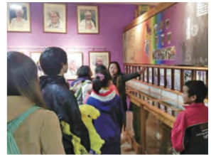
103年 魯巴斯： 萬榮國小(太魯閣族)