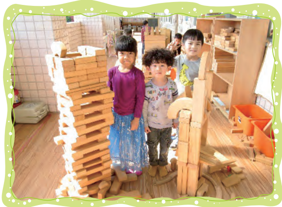
單位積木建構出夢想中101大樓