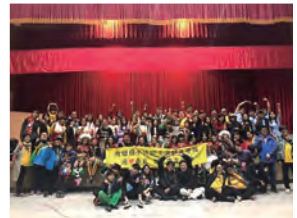
107年 織羅： 春日國小(阿美族)