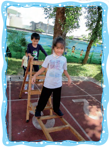
水谷式爬梯大挑戰