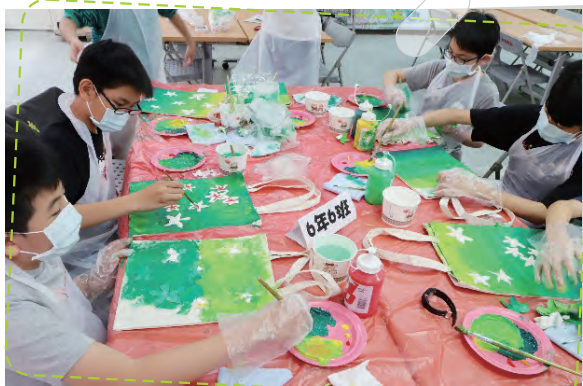
六年級師生彩繪畫提袋 與畫家有約揮灑創意