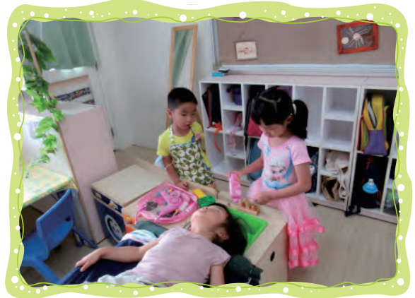
美髮院裡美髮師在幫客人洗頭