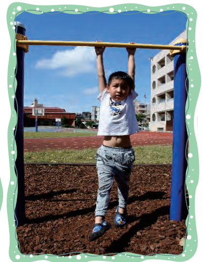
我可以撐得很久喎！