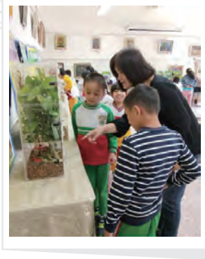
昆蟲展 了解生物特性